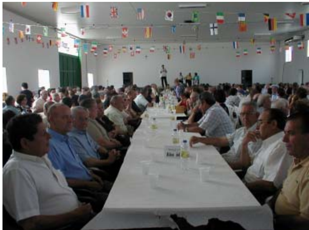
Excmo. Ayuntamiento de Granátula de Calatrava