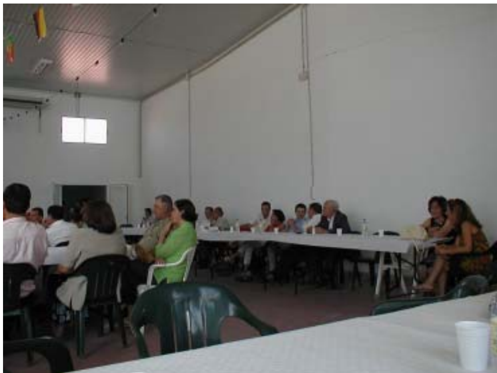
Excmo. Ayuntamiento de Granátula de Calatrava