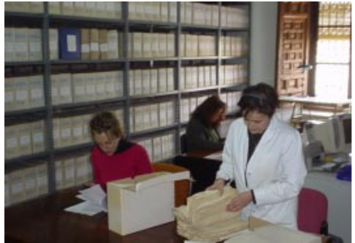
Una labor, al servicio de los ciudadanos y el conocimiento de los distintos pueblos

Toda esta documentación ha sido instalada en cajas de tamaño