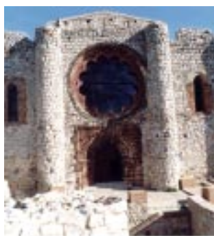
Una comarca con fuertes lazos de unión

Con el objetivo de propiciar el desarrollo rural de la comarca del Campo de Calatrava, a través del decidido apoyo institucional a la consolidación de la Cultura, con la conservación de los Archivos Históricos Municipales, la Mancomunidad de Municipios edita el presente Boletín Informativo