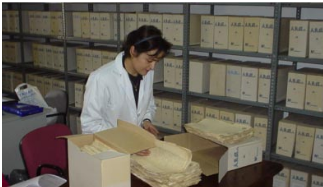
Los Excmos. Ayuntamientos y la Mancomunidad de Municipios del Campo de Calatrava apuestan por la Cultura